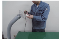
立ち作業にも対応。